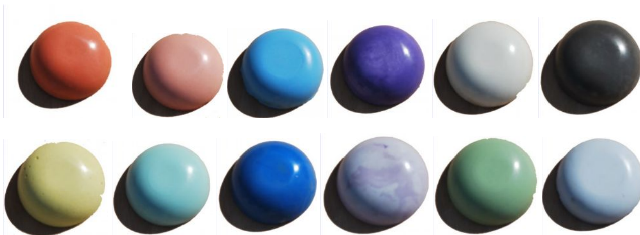
Couleurs informatiques non contractuelles

La variation du poids de pigment ajouté à l'enduit permet d'obtenir une infinie déclinaison de couleurs. Ces quelques couleurs représentées, ne sont qu'une pâle possibilité de la gamme. Des essais préalables de dosage sont recommandés.